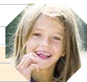
Opzione day course

La tabella illustra un programma tipo, in cui gli orari sono riportati a titolo di esempio. L'opzione "Day Course", evidenziata in giallo, prevede solo il programma diurno. Per visionare un esempio di programma settimanale rivolgersi a Oxford Viaggi.