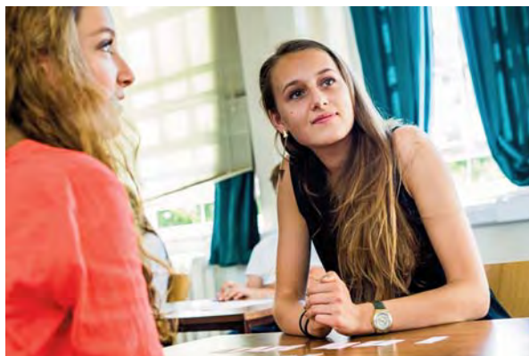
Esempio di orario programma “English World-Senior”

Il programma didattico prevede 25 ore di lezione settimanali, svolte in classi internazionali di massimo 8 allievi .